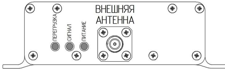
Рисунок 1 – Лицевая панель усилителя с индикаторами

На лицевой панели усилителя размещен разъём для внешней антенны ( ВНЕШНЯЯ АНТЕННА ) и индикаторы режимов работы. На тыльной панели расположен разъём для внутренней антенны ( ВНУТРЕННЯЯ АНТЕННА ) и разъем питания ( ПИТАНИЕ ).