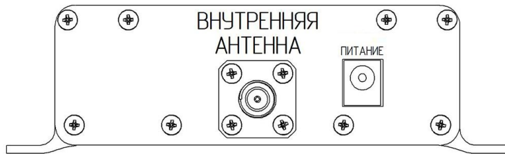
Рисунок 2 – Тыльная панель усилителя